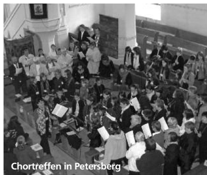
Chortreffen in Petersberg