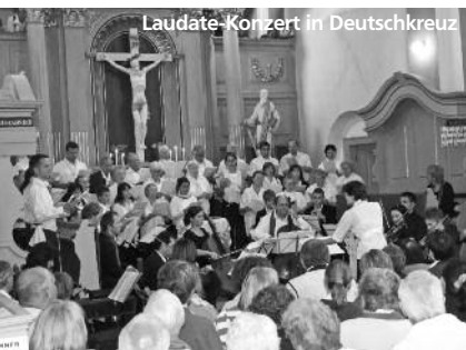
Laudate-Konzert in Deutschkreuz

PS: Ihre Spende überweisen Sie bitte mit dem beigelegten Überweisungs- träger bzw. nur auf das dort angegebene Konto.