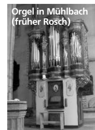
Orgel in Mühlbach (früher Rosch)

Die Fotos zeigen einige Facetten der kirchenmusikalischen Arbeit in Siebenbürgen, wo noch ein deutschsprachiges Erbe praktiziert wird. Die Kirchenmusik ist ein verbindendes Element der ev. Gemeinden.