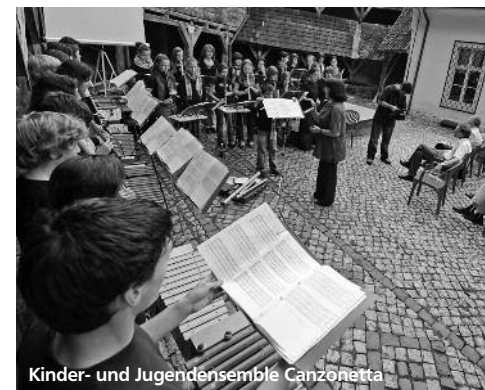
Kinder- und Jugendensemble Canzonetta

Verband evangelischer Kirchenmusikerinnen und Kirchenmusiker in Deutschland