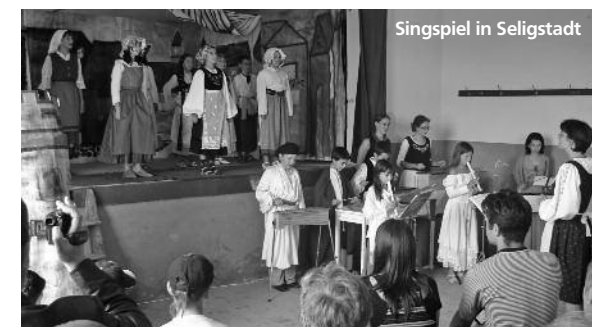
Singspiel in Seligstadt