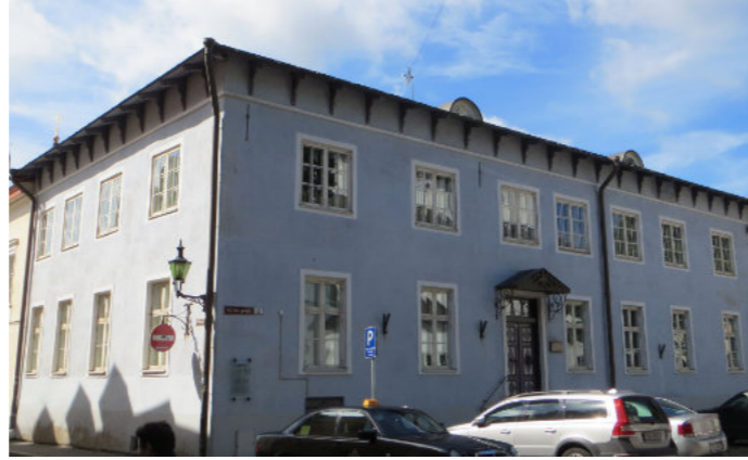
Das Konsistorium am Kirchplatz, die kirchliche Verwaltung und Amtssitz des Erzbischofs.

mit einsetzender Russifizierung 1885 kamen Deutsch aber auch Estnisch als Sprachen unter Druck. Der unselige Nationalismus hatte nun auch das Baltikum erreicht. Nach dem 1. Weltkrieg gab es eine kurze Phase der Unabhängigkeit, der aber der Hitler-Stalin-Pakt ein Ende bereite. Dieser Pakt führte dazu, dass fast alle deutsch Sprechenden das Land verließen und ins Deutsche Reich übersiedelt wurden. So spielt heute Deutsch in Estland kaum eine Rolle und nur knapp 2.000 Menschen bezeichnen sich als deutschsprachig.