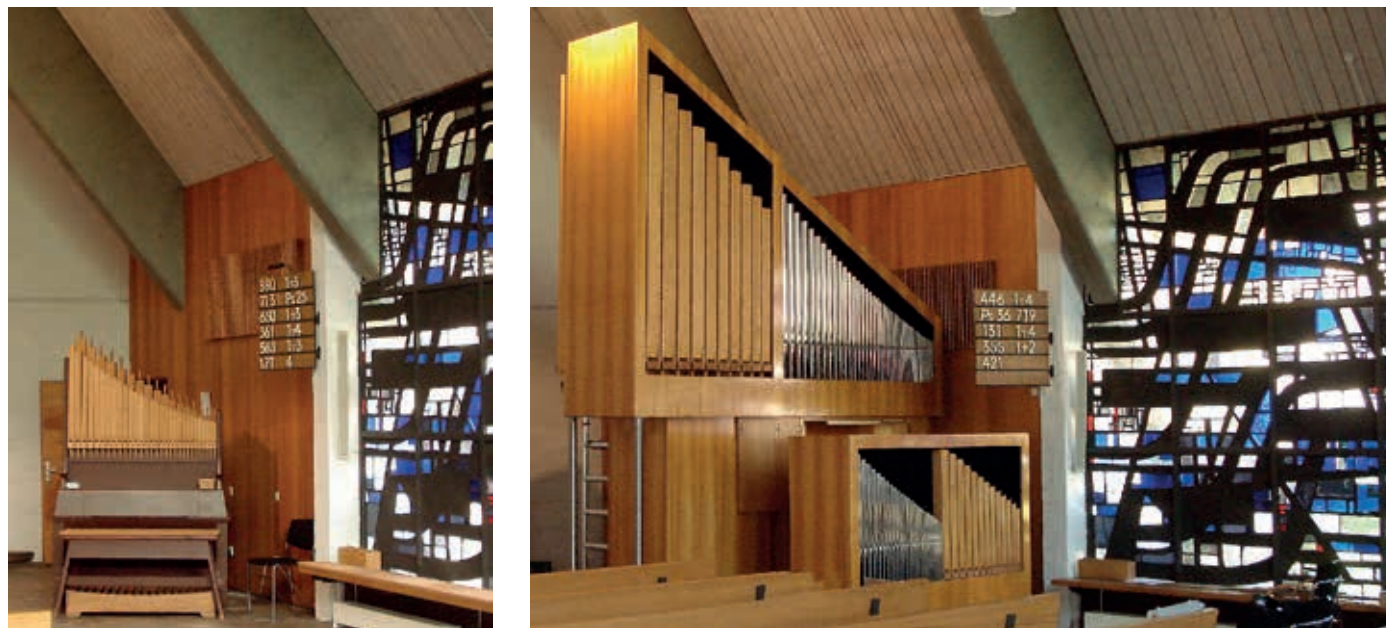
■ Friedenskirche Leinfelden-Oberaichen, Vorzustand mit Weigle-Positiv (links), seit 2020 mit Füglistler-Organ (CH) von 1965

In vielen Fällen werden von den kaufenden Kirchengemeinden freiwillige Hilfskräfte beim Transport schwerer Teile in den neuen Raum gestellt. Sofern hier alle versicherungstechnischen Fragen geklärt sind, kann dies helfen, zusätzliche Kräfte des Orgelbauers und damit Kosten einzusparen.