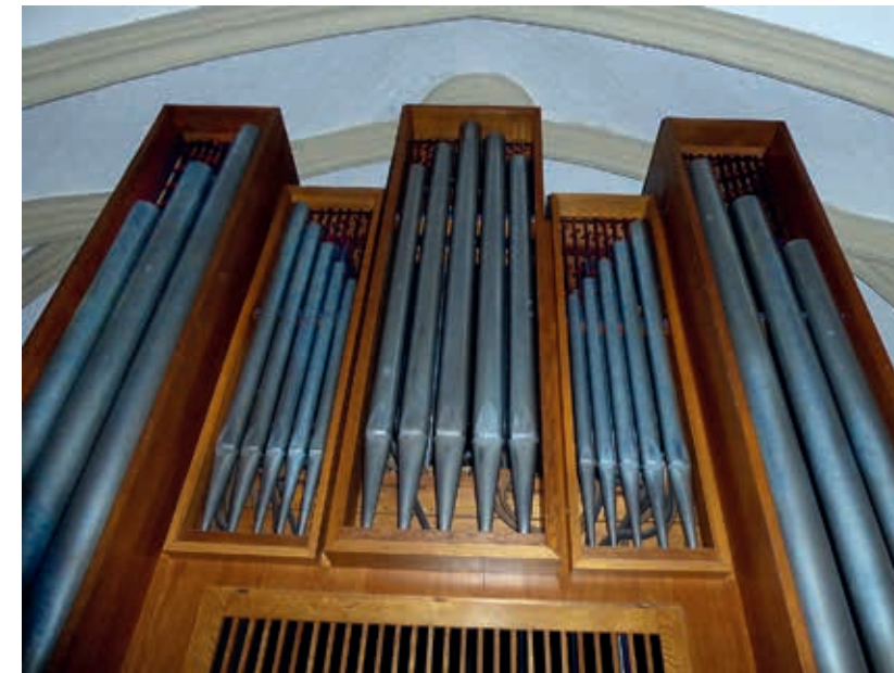
■ Führer-Organ von 1965 in der Osterkirche Hamburg-Eilbek (oben), seit 2019 in der Christuskirche Crailsheim (rechts)

Und schließlich: Von einem Verkauf über eBay wird abgeraten. Dies hat eine „beratungsresistente“ Kirchen-