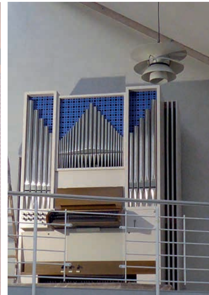
■ Schuke-Orgel von 1989, ursprünglich in der Nikolaikirche Münster-Roxel (links), seit 2019 in der Lukaskirche Schwäbisch Hall (rechts)

weniger, da nicht selten Äußerlichkeiten zu einer Art Kauf-Euphorie führen („... die Orgel ist so schön blau, die passt doch so gut zu unserem Altarteppich ...“) oder die Interessenten manchmal auch durch den Verkäufer zu sehr beeinflusst werden.